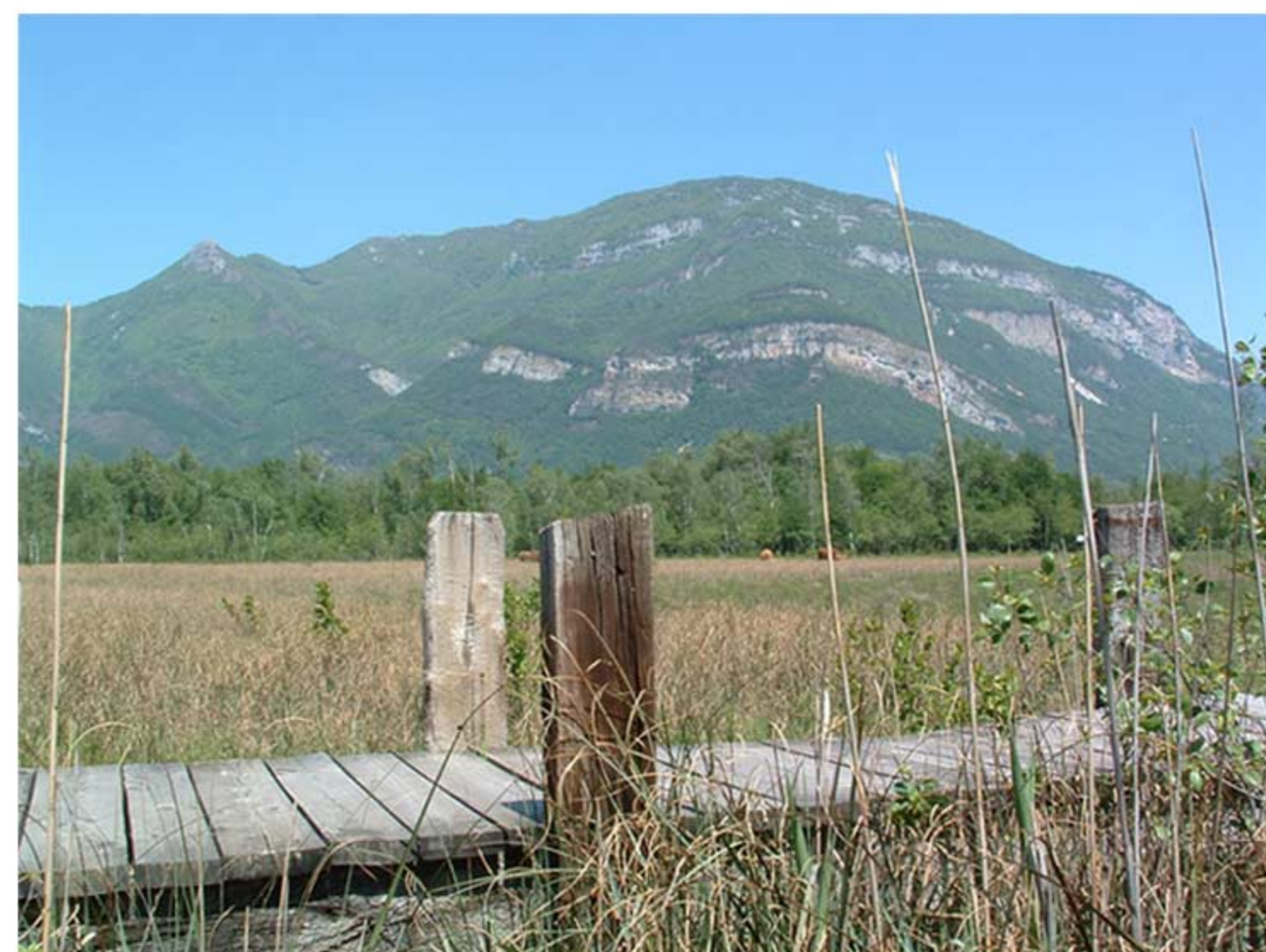
Le Grand Colombier

Penser sentiers, c'est d'abord penser Grand Colombier . L'imposant bastion qui domine Culoz, est une référence identitaire pour chaque Culozien.