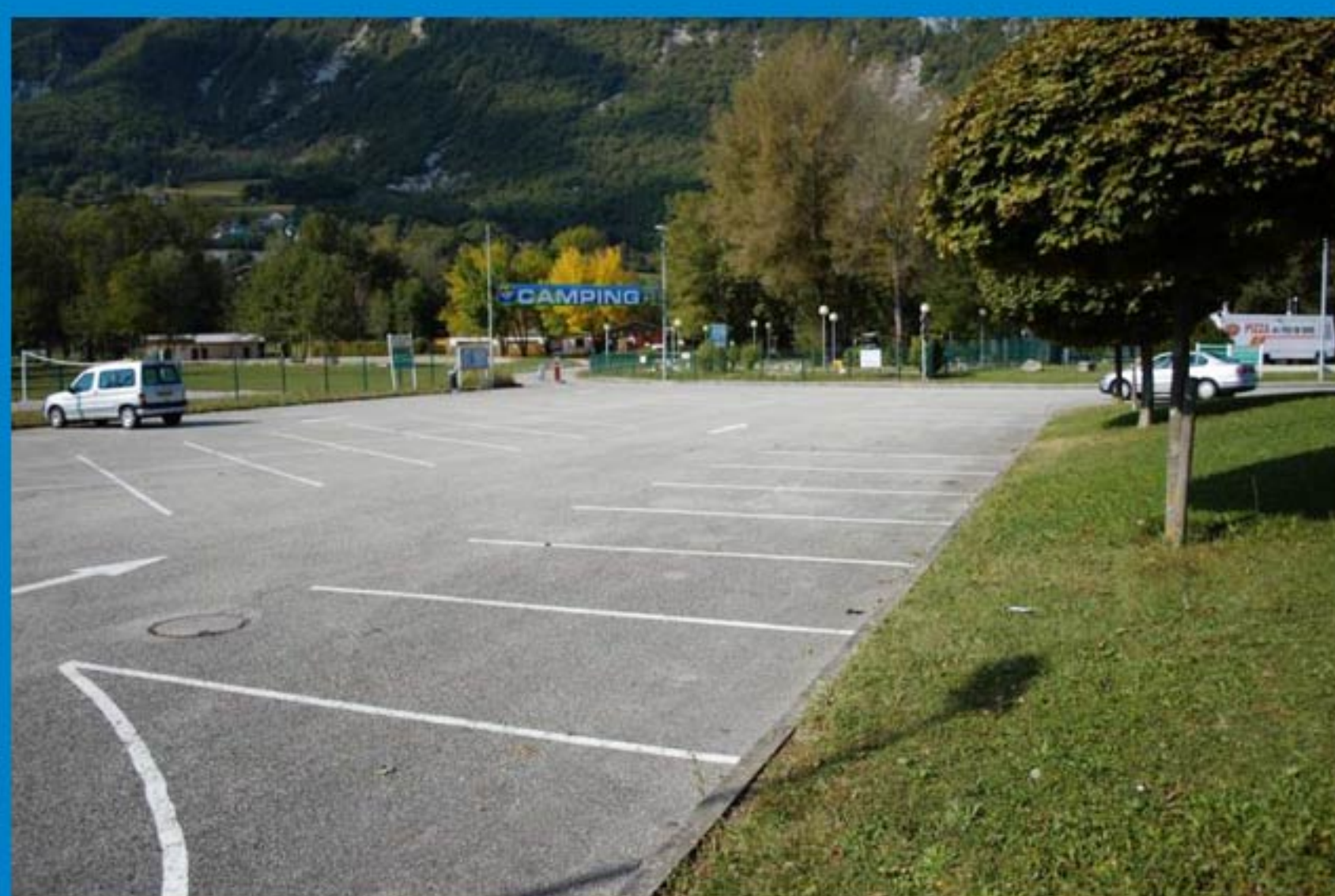
Parking du Plan d'eau (6 places)