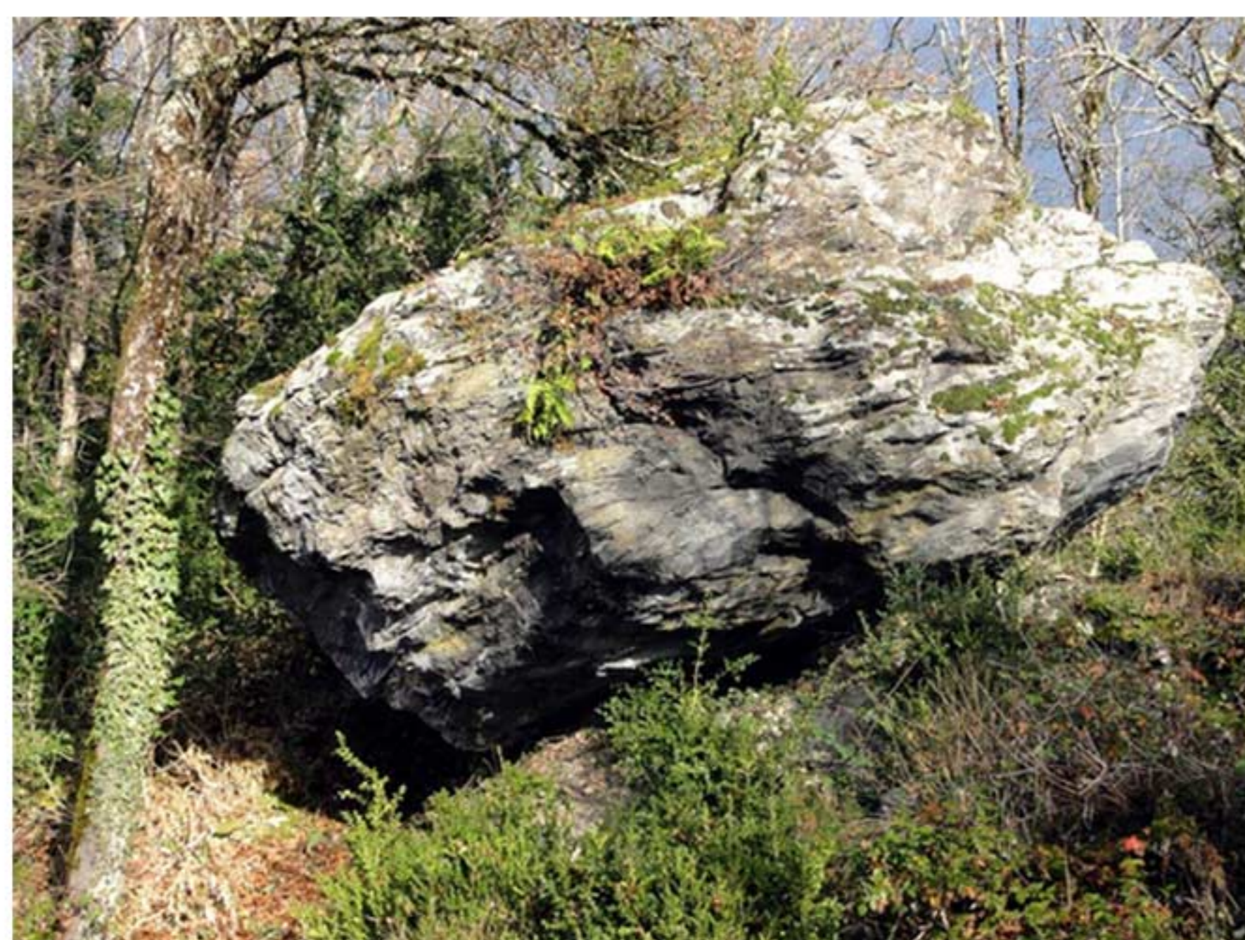
La Pierre Levanaz

Le Jugeant, avec une belle vue sur les marais et les monts du Bugey, offre un parcours de détente agrémenté de la fameuse Pierre Levanaz , cadeau venu de Suisse et déposé là par les glaciers voici une trentaine de milliers d'années.