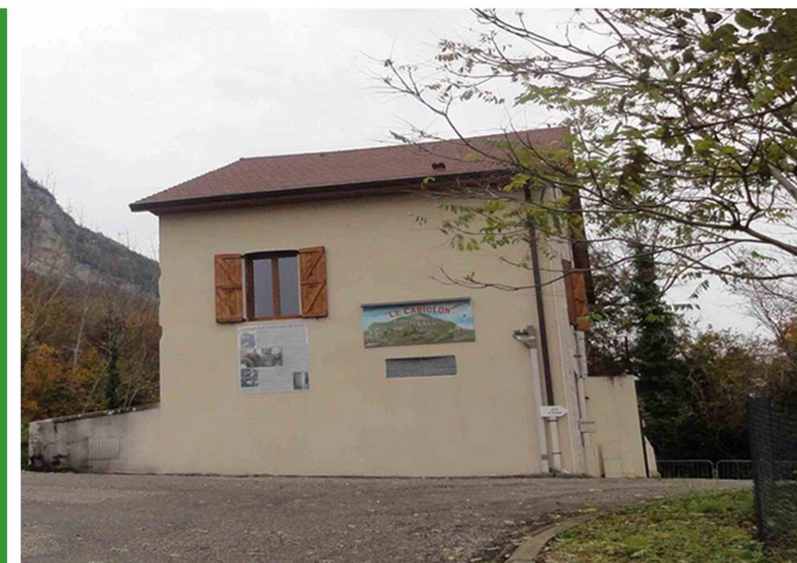
Gîte d'étapes, Le Cabiolon