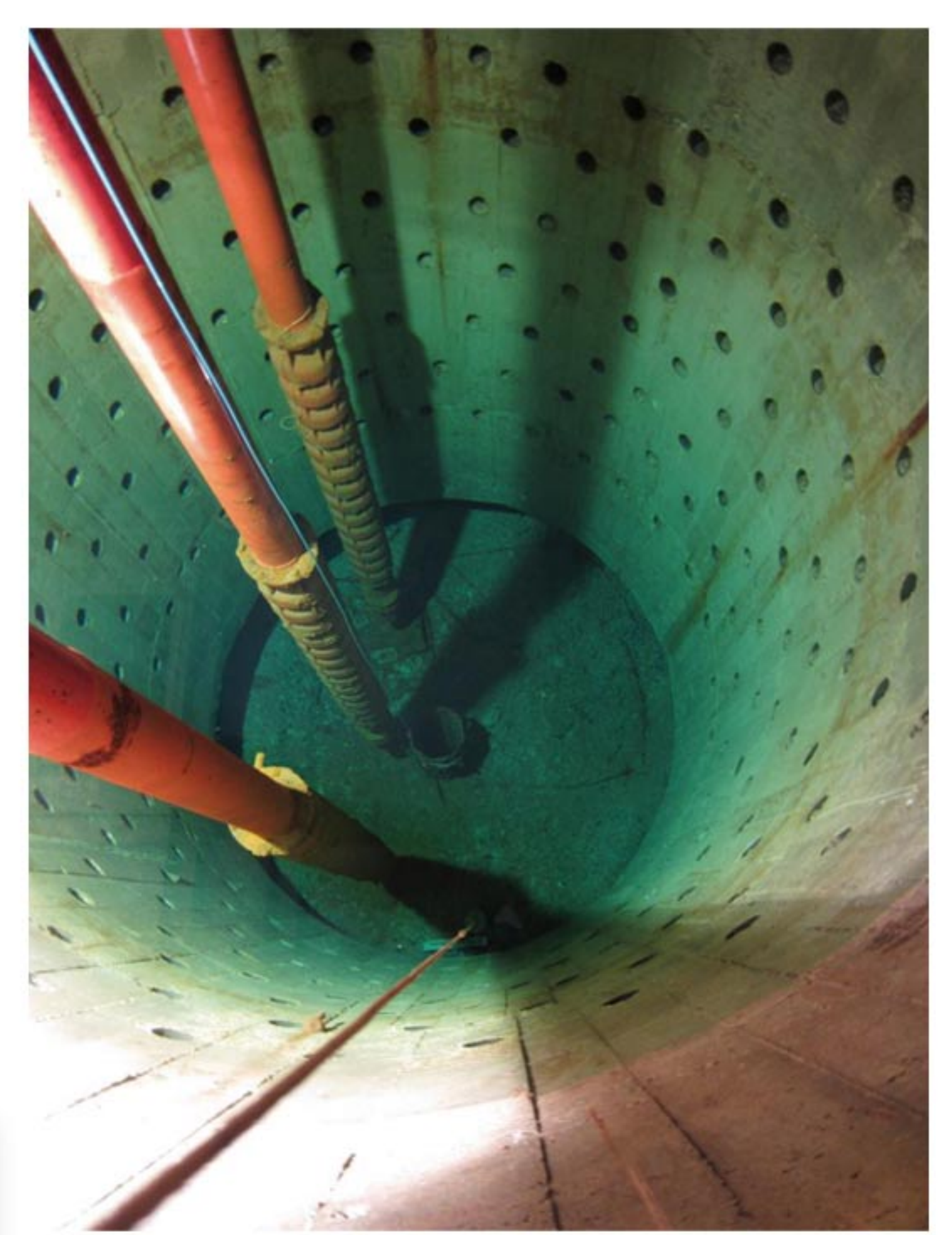
Puits de la Patte d'Oie - Profondeur 9 m

Pensons à l'avenir, maîtrisons notre consommation afin de conserver un prix de l'eau juste et raisonnable.