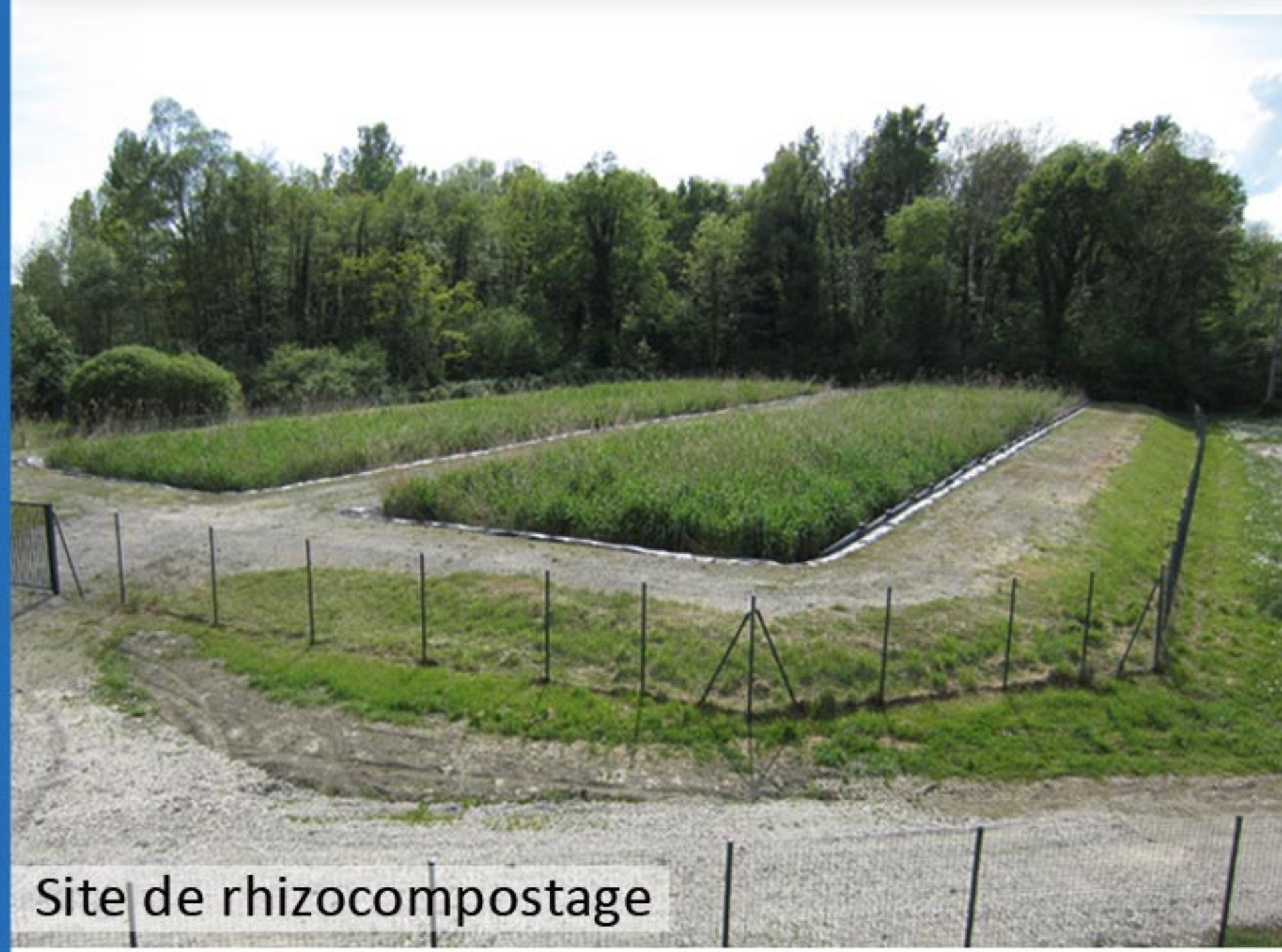
Site de rhizocompostage

RAPPEL AUX NOUVEAUX PROPRIÉTAIRES : Il est indispensable de vous faire connaître auprès du service des eaux au plus tôt, afin d'établir le contrat d'abonnement correspondant au branchement concerné et ainsi éviter toute erreur dans la facturation (changement de propriétaire, d'adresse...).