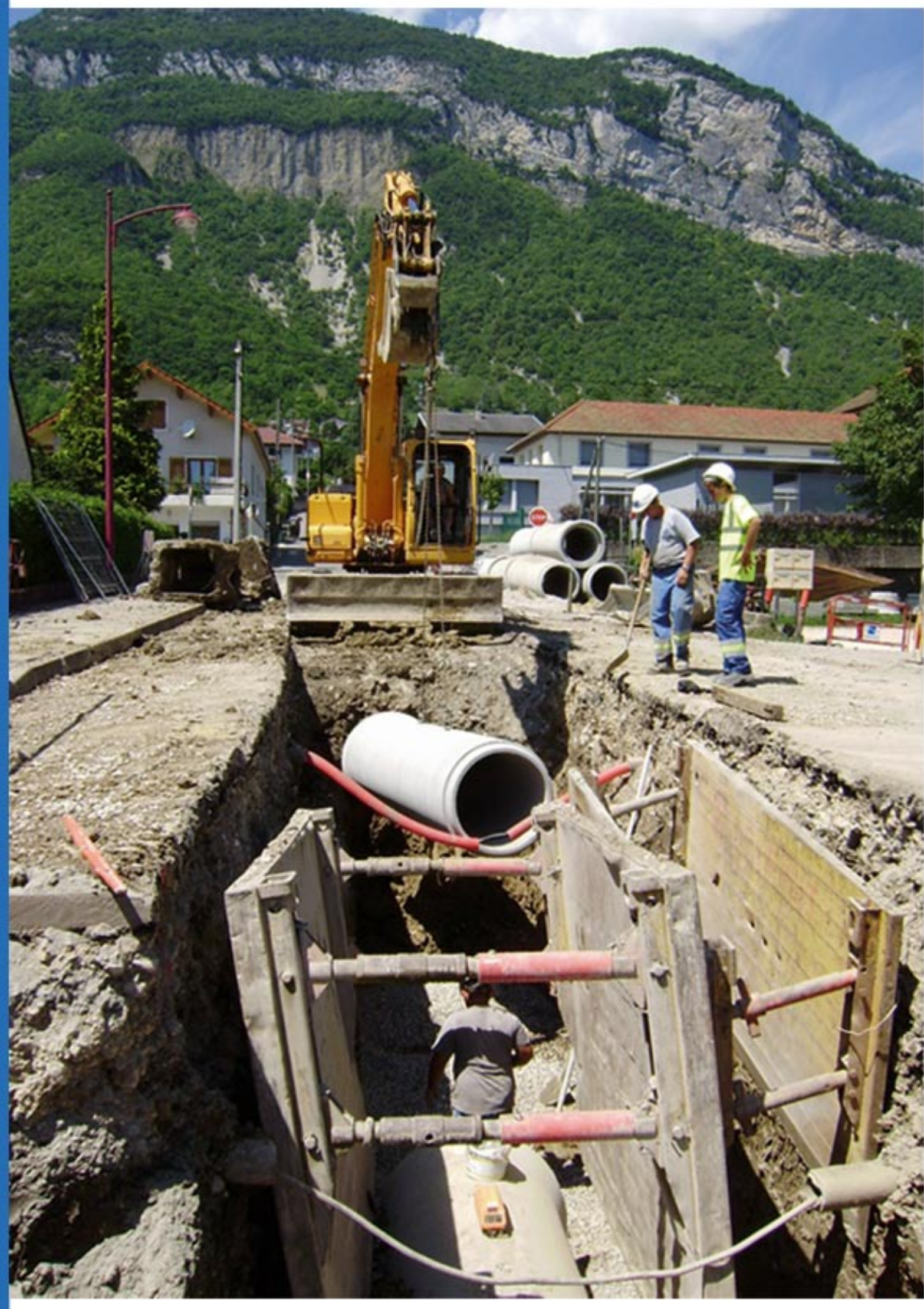
Renouvellement d'une canalisation

Nous exploitons par un puits de captage une ressource en eau d'une qualité exceptionnelle qui ne nécessite aucun traitement car elle est extrêmement pure. Des analyses d'eau sont réalisées régulièrement par le laboratoire CARSO sous la direction de l'Agence Régionale de Santé. Les résultats sont consultables à la mairie et sur le site internet de la commune : http://www.culoz.fr/img/analyse-eau.pdf